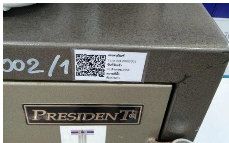
รูป 7.1 QR code รหัสครุภัณฑ์